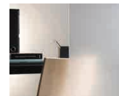
Stratobel White Mat 80