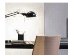
Stratobel Mineral Grey