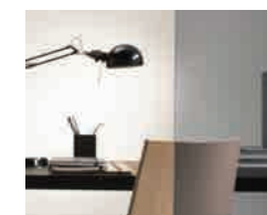
Stratobel Stone Grey