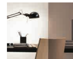
Stratobel Terra Brown