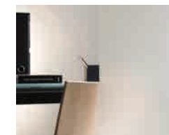
Stratobel White Mat 65