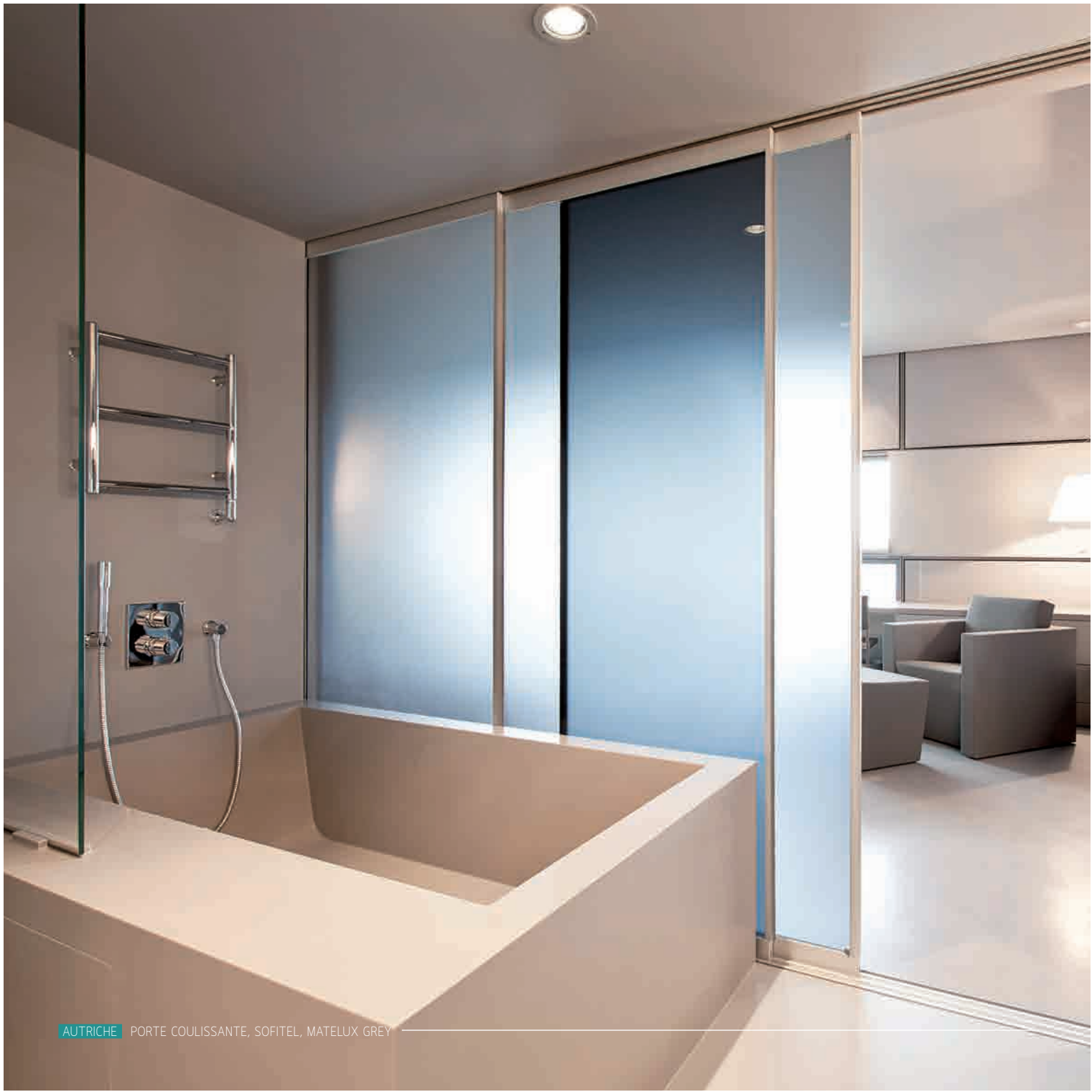
AUTRICHE PORTE COULISSANTE, SOFITEL, MATELUX GREY