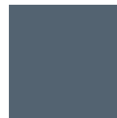
Zen Grey Ref 6005