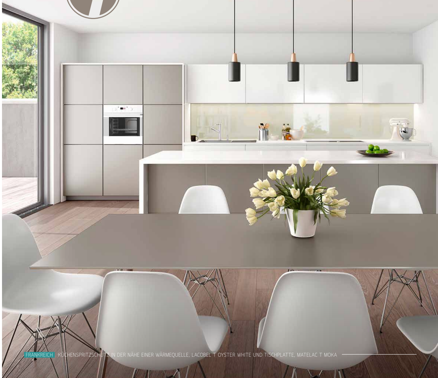
FRANKREICH KÜCHENSPRITZSCHUTZ IN DER NÄHE EINER WÄRMEQUELLE, LACOBEL T OYSTER WHITE UND TISCHPLATTE, MATELAC T MOKA