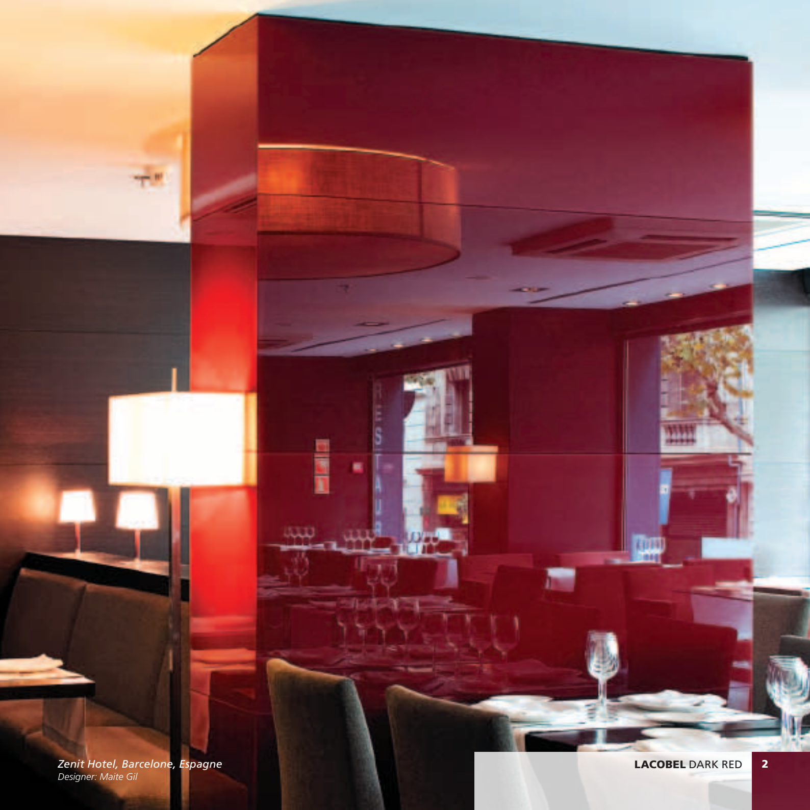
Zenit Hotel, Barcelone, Espagne Designer: Maite Gil