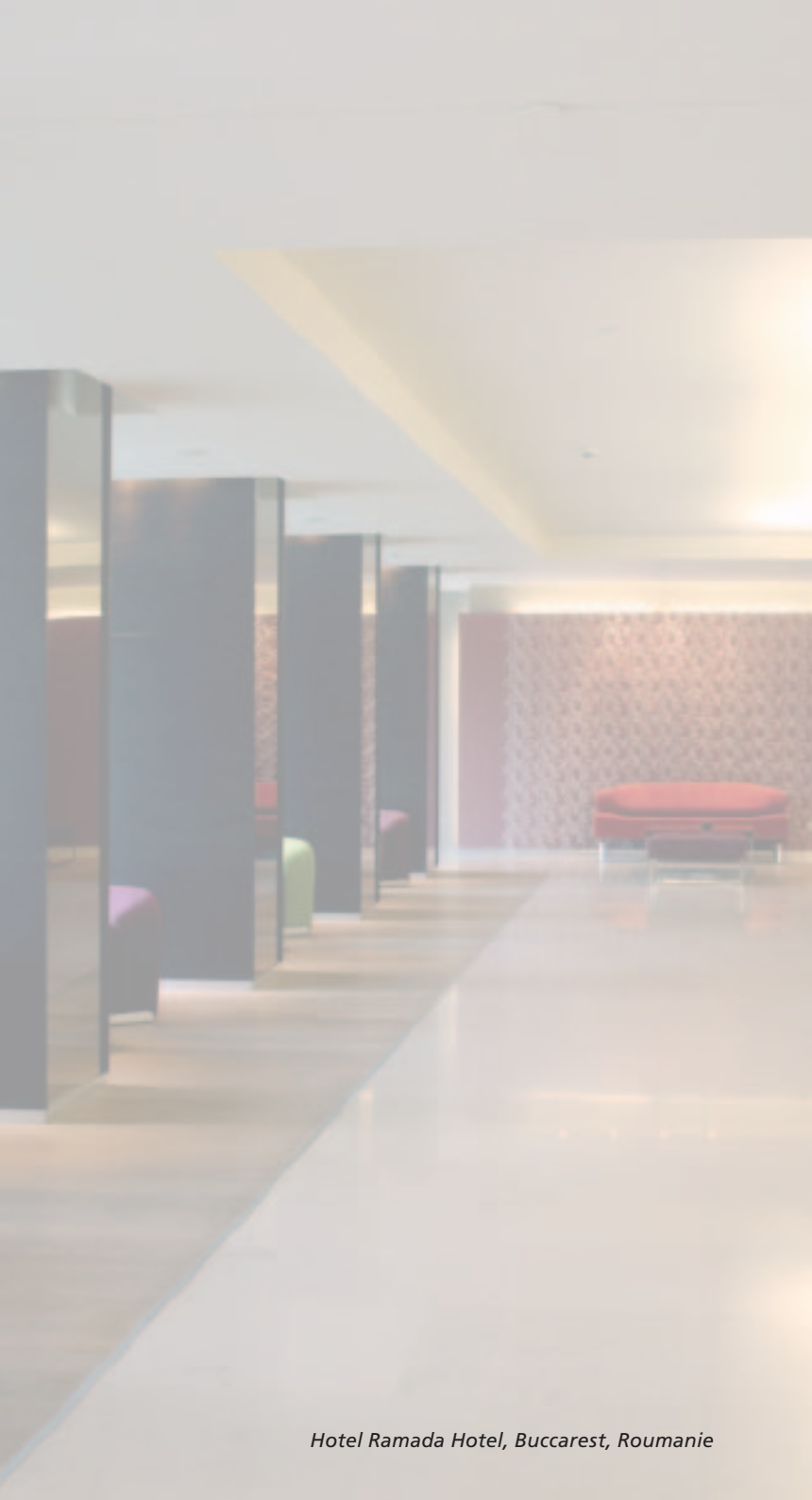
Hotel Ramada Hotel, Bucarest, Roumanie