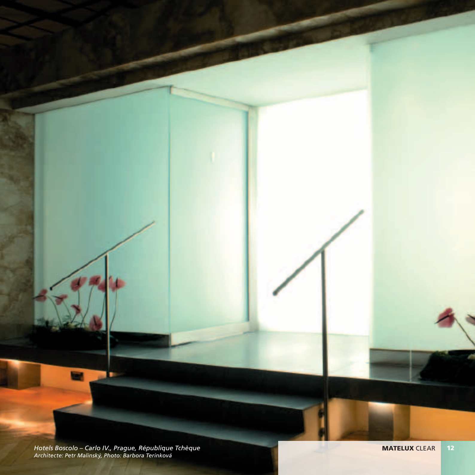
Hotels Boscolo – Carlo IV., Prague, République Tchèque Architecte: Petr Malinský, Photo: Barbora Terinková