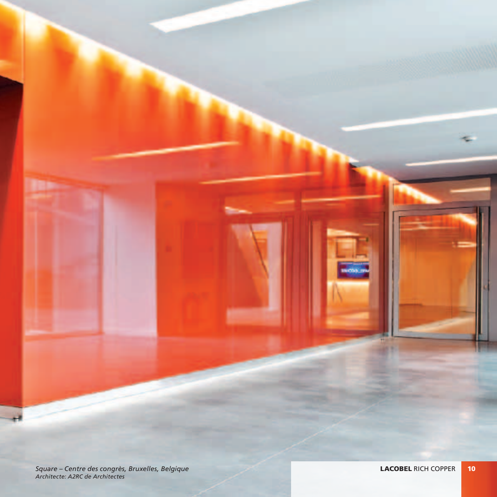
Square – Centre des congrès, Bruxelles, Belgique Architecte: A2RC de Architectes