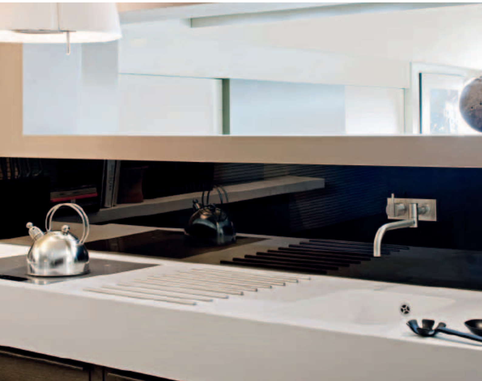
Cuisine, Bruxelles, Belgique