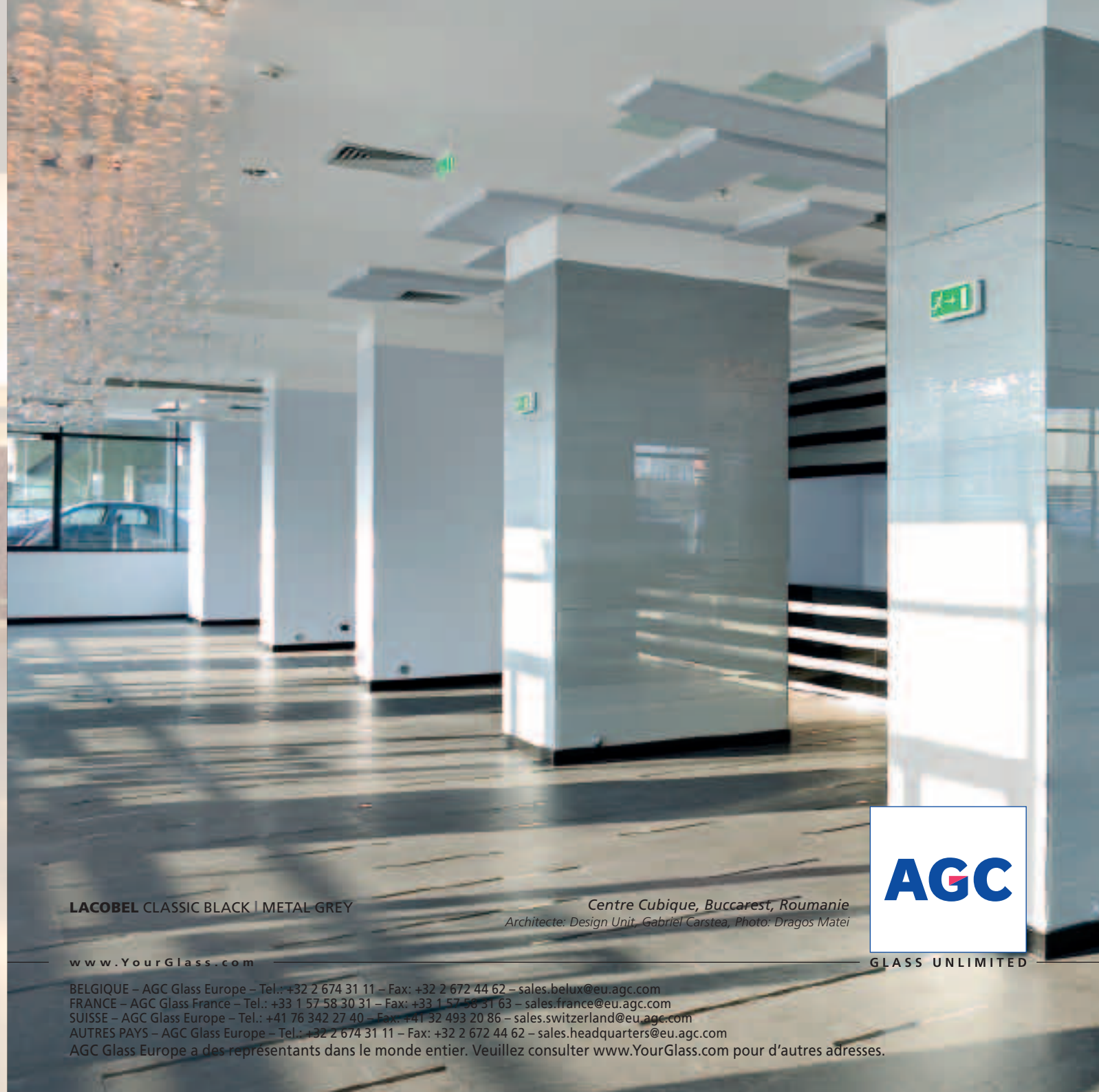
LACOBEL CLASSIC BLACK | METAL- GREY