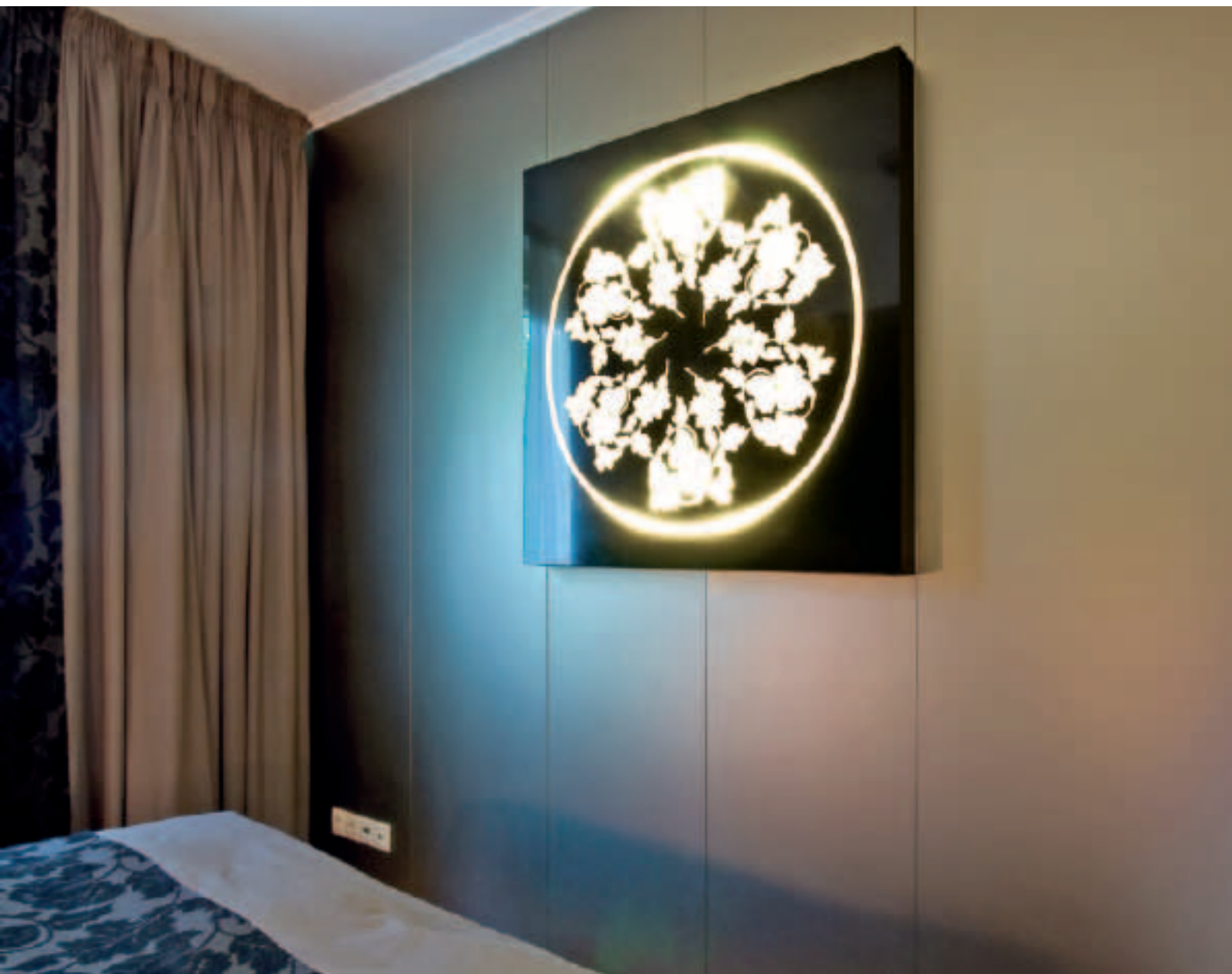
Holiday Beach Hotel, Budapest, Hongrie Architecte: Ms. Ágnes Tóth

LACOBEL CLASSIC BLACK & MATELAC SILVER BRONZE