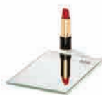
Clear Base float normale