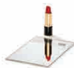
Clearvision Base float particulièrement neutre, pour une esthétique épurée