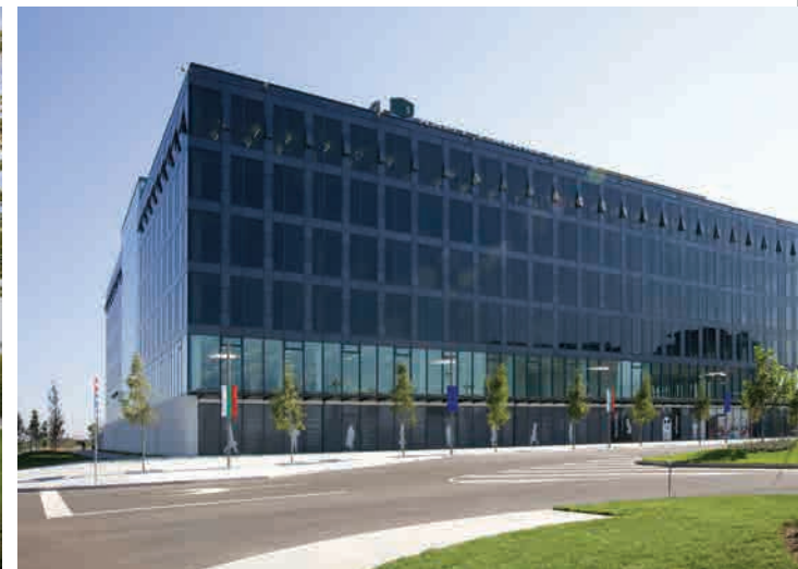
BULGARIA SOFÍA, CENTRO AEROPORTUARIO - STOPRAY TITANIUM 37T Y IPLUS ENERGY N - CIGLER MARANI ARCHITECTS - LEED GOLD

Para más información consulte el informe anual de sostenibilidad de AGC en www.agc-glass.eu/en/sustainability o envíe sus preguntas y/o sugerencias por correo electrónico al departamento Sustainability & Product Stewardship en sustainability@eu.agc.com .