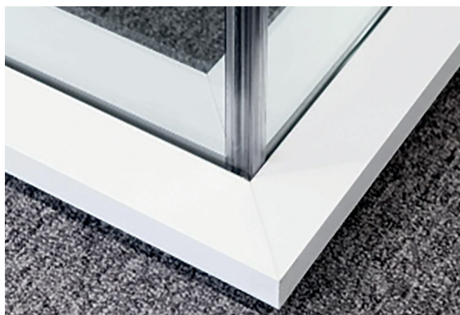
Cloison avec un verre Stratophone