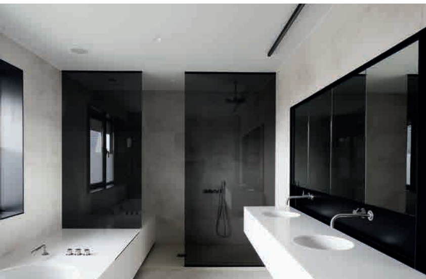
BELGIQUE PARE-DOUCHE, MAISON PRIVÉE, PLANIBEL DARK GREY ©REID SENEPART ARCHITECTEN