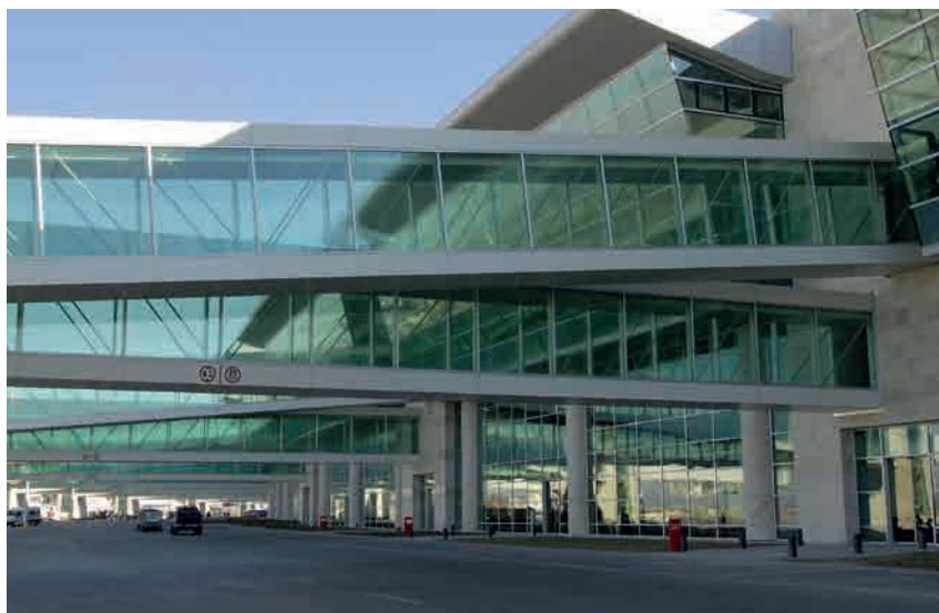
TURQUIE REVÊTEMENT DE FAÇADE, AÉROPORT, PLANIBEL GREEN