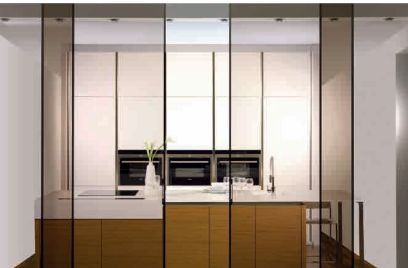
HONGRIE PORTES COULISSANTES, PLANIBEL BRONZE