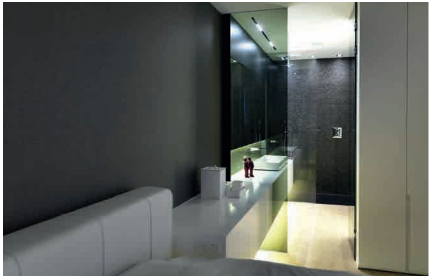
BELGIEN TRENNWAND, PLANIBEL GREY - ©PHOTOJOOST