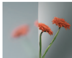
Szkło przezroczyste Zwykłe szkło float