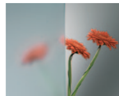
Linea Azzurra Szkło float z delikatnym odcieniem niebieskim