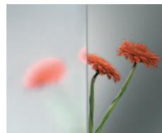
Clearvision Szkło float o wysokiej przezroczystości dla uzyskania czystej estetyki