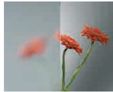
Clear Base de vidrio float normal