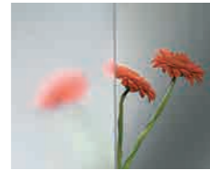
Clearvision Base de vidrio óptico altamente transparente para lograr una estética neutra