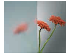
Linea Azzurra Base de vidrio float de color ligeramente azulado