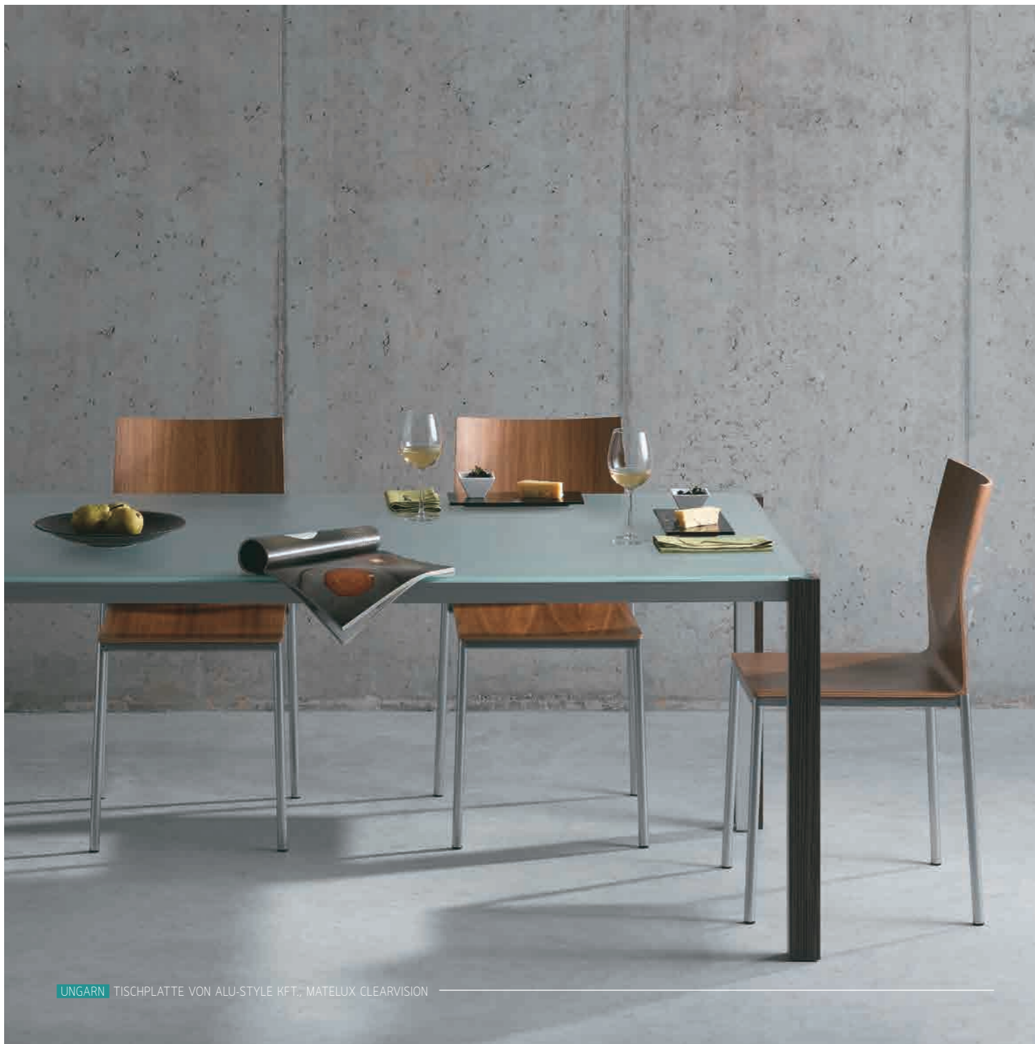
UNGARN TISCHPLATTE VON ALU-STYLE KFT., MATELUX CLEARVISION

Matelux ist in den Abmessungen von 200 bis 600 cm x 321 cm erhältlich – Für alle Architekturanwendungen verwendbar