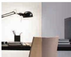
Stratobel Mineral Grey