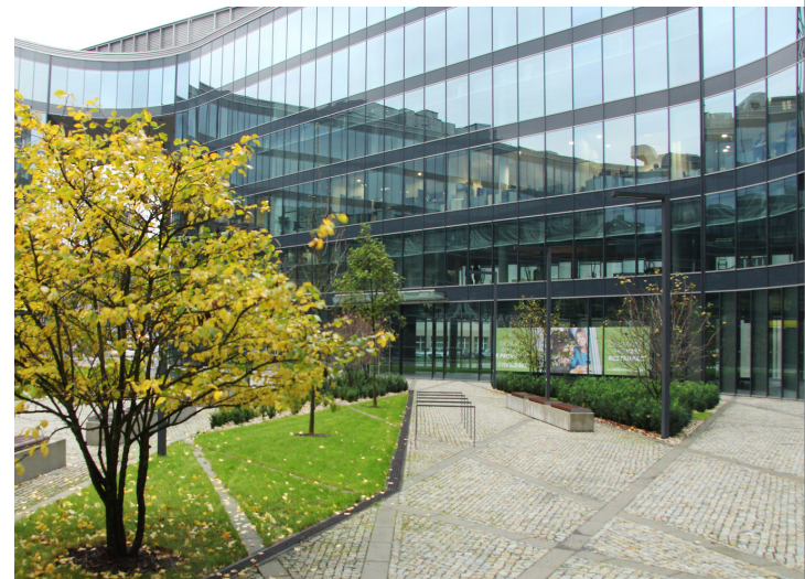
CZECH REPUBLIC OSTRAVA, NOVÁ KAROLINA PARK OSTRAVA - STRATOBEL STOPRAY 66.2 AND STRATOBEL STOPRAY 66.2 - CMC ARCHITECTS - BREEAM VERY GOOD

Para más información consulte el informe anual de sostenibilidad de AGC en www.agc-glass.eu/en/sustainability o envíe sus preguntas y/o sugerencias por correo electrónico al departamento Sustainability & Product Stewardship en sustainability@eu.agc.com .