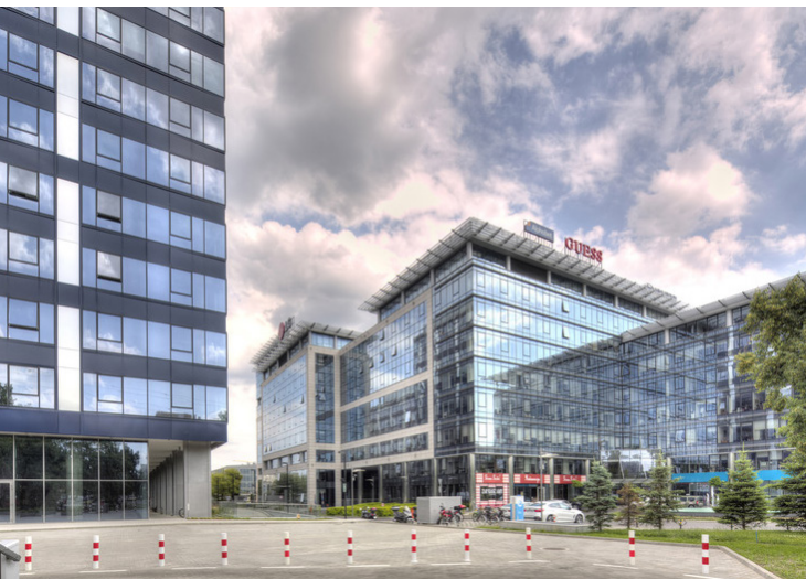
POLONIA VARSOVIA, MOKOTÓW NOVA - STOPRAY VISION-50 SOBRE CLEARVISION Y STOPRAY VISION-50T - JASPERS-EYERS - BREEAM VERY GOOD