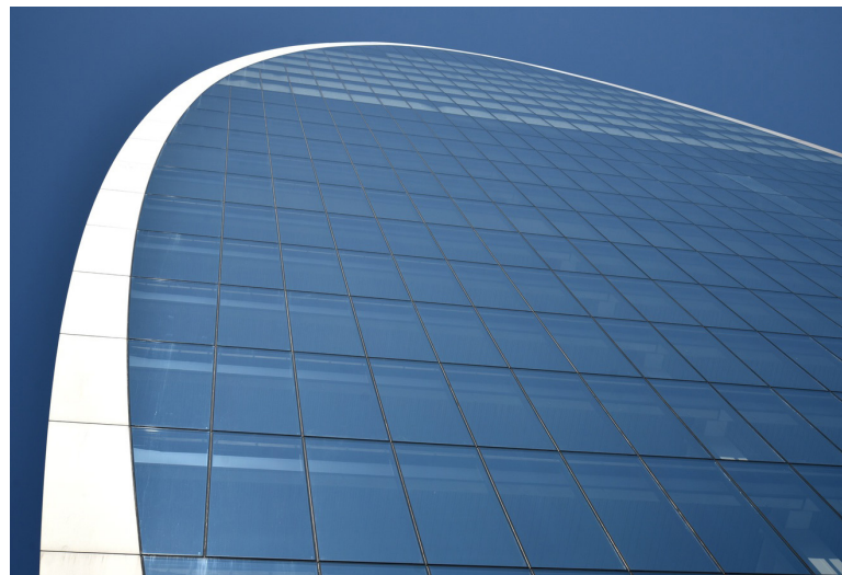
REINO UNIDO LONDRES, 70 ST MARY AXE, STOPRAY VISION-60 SOBRE CLEARVISION - FOGGO - BREEAM EXCELLENT