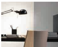
Stratobel Stone Grey