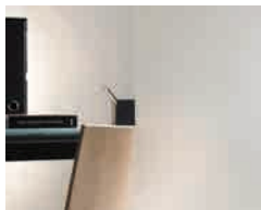
Stratobel White Mat 65